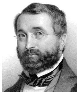
Изобразительный ряд к заданию № 3