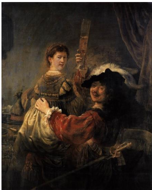
Изобразительный ряд к заданию № 5.