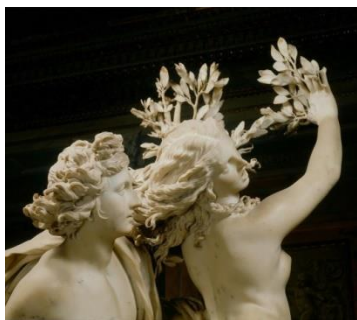
Изобразительный ряд к заданию № 2