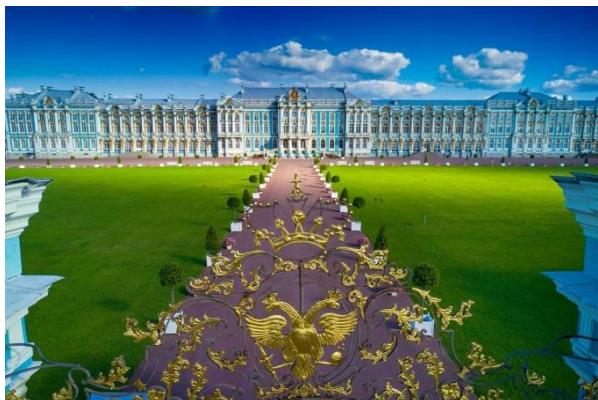
Изобразительный ряд к заданию № 6